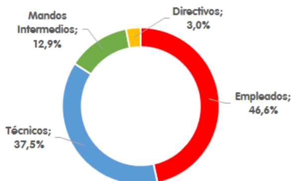
2015: DISTRIBUCIÓN POR CATEGORÍA PROFESIONAL DE LA OFERTA DE EMPLEO PARA FP