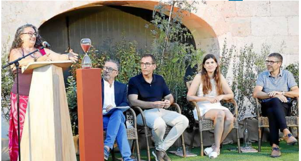
El escenario con los ponentes de esta decimosexta edición del Foro Menorca Illa del Rei sobre la Inteligencia Artificial.