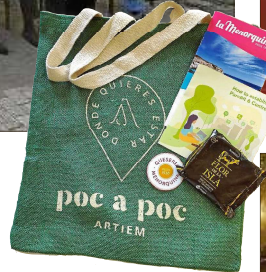
Apoyo y degustaciones. El Centre BIT Menorca apoyó el Foro de forma decidida, entre más de veinte patrocinadores. También ofrecieron sus productos Binigarba, Coinga, La Menorquina, Artiem y Quesería Menorquina.